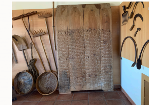
Colección con más de cincuenta útiles agrícolas

Es el conjunto más amplio del museo, fiel reflejo de lo que fue la base de la economía rural de los últimos siglos.