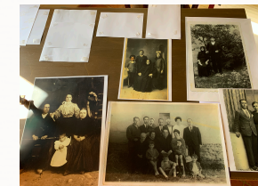
Memoria visual de un pueblo

Es una de las secciones más apreciadas por los vecinos. Se compone de más de cincuenta fotografías que abarcan desde finales del siglo XIX hasta la década de los ochenta del siglo XX. En ellas se pueden apreciar los modos de vida y las costumbres de las gentes de un pueblo leonés