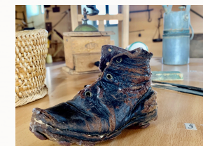
Zapatilla infantil de principios del siglo XX

Desde platos de cerámica, chocolateras, pasando por candiles y cunas infantiles hasta llegar a pupitres de niños y juegos infantiles